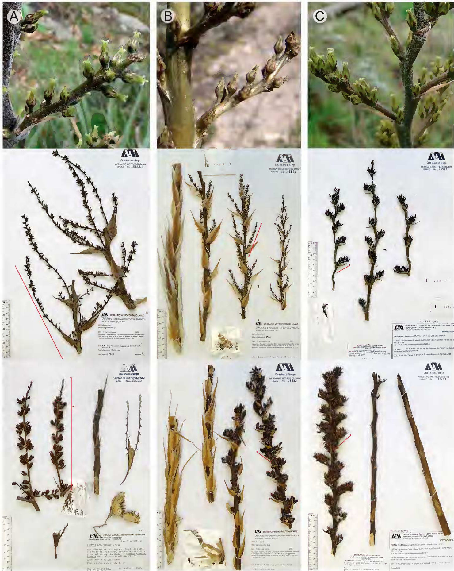
Fig. 4. Inflorescencias femeninas. A. H. montis-frigidi González-Rocha, Espejo, López-Ferr. et Cerros-Tlatilpa (A. R. López-Ferrari 2205; frutos, A. Bonfil 234). B. H. podantha Mez (A. Espejo 6889; frutos, N. Martínez C. 38). C. H. chichinautzensis Martínez-Correa, Espejo et López-Ferr. (N. Martínez C. 39; frutos, N. Martínez C. 104). Fotografías A. Espejo y E. González-Rocha.